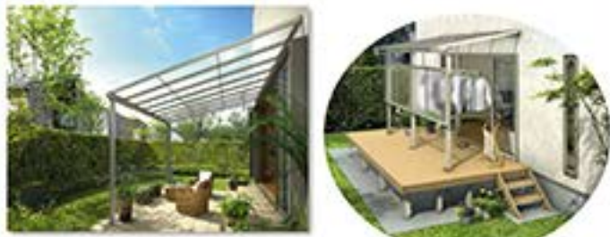
YKK AP ソラリア テラス屋根