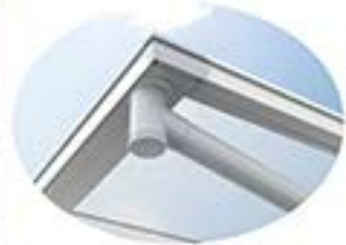
積りに詰まった枯葉やごみも 取り出しやすい構造です。