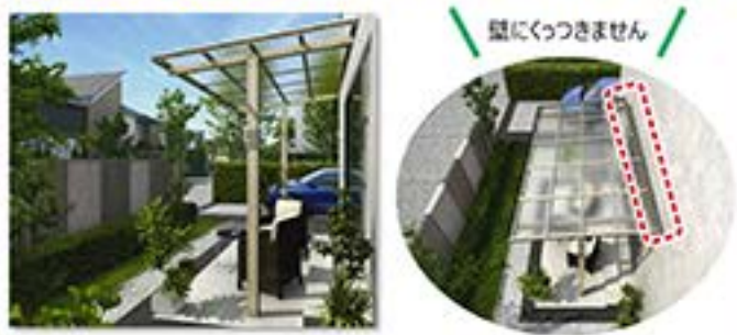
YKK AP 独立テラス屋根 エフルージュ グラン ZERO