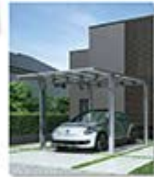
YKK AP エフルージュ FIRST