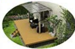
アウトドアリビングとして 心地よい空間を実現します。